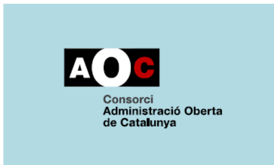
2. 3 tintes o més