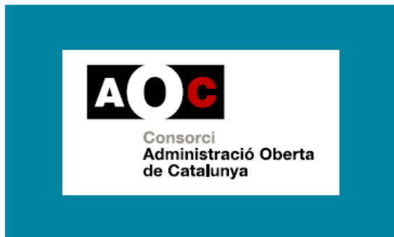
2. 3 tintes o més