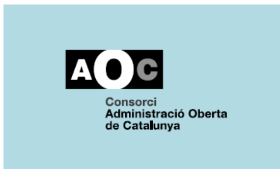
4. 2 tintes