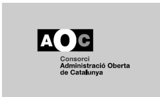
5. 1 tinta (reproducció en B/N)