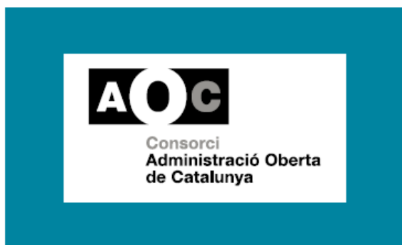
3. 2 tintes