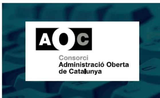
4. 2 tintes