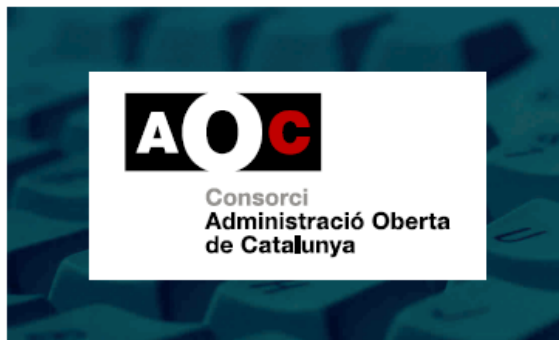
2. 3 tintes o més