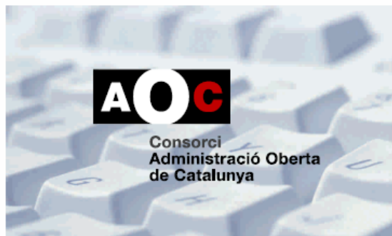
2. 3 tintes o més