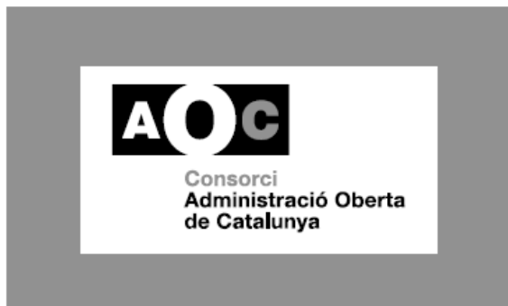
5. 1 tinta (reproducció en B/N)