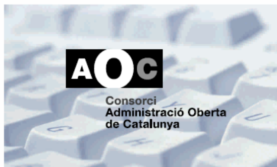
4. 2 tintes